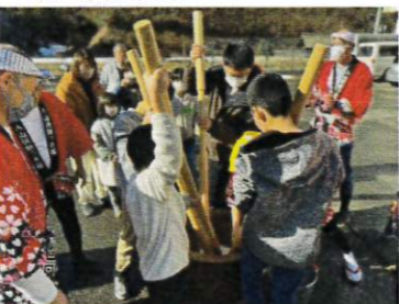
つきたてのお餅は柔らかくて美味しいね!↑