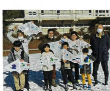
白い凧がよく映える綺麗な青空でした→

遊びや食などの文化は日々変化していきますが、「昔からあるもの」の良さを子供たちに少しでも感じてもらうのではないのでしょうか。